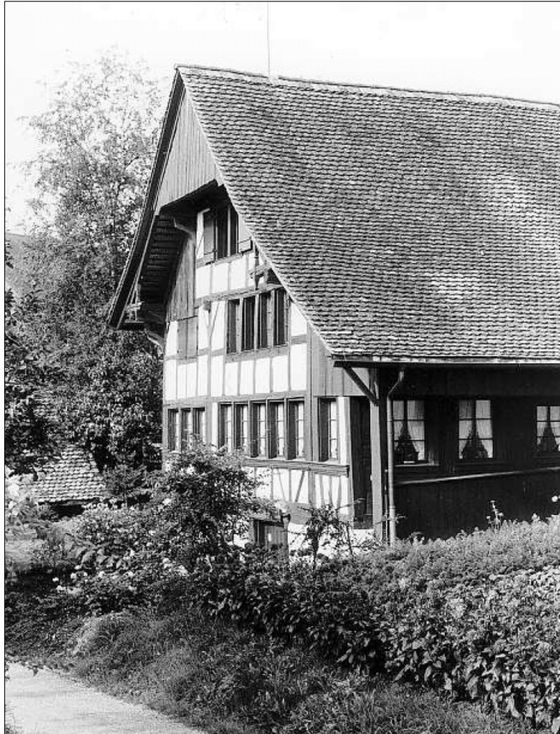
Das Alte Schulhaus von 1660, renoviert 1980, heute Johanna-Spyri-Museum.

Nicht ganz wohl fühlte sich in den doch eher engen Räumen die Bibliothek, die dann im neuesten Schulhaus